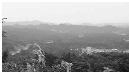
本丸より春日山城跡を望む

本丸への登山道は3つある。史跡公園の管理棟脇から登る北登城道が平易で一般的であるが、城の遺産が多く見られる東登城道(大手門)か南登城道(正面口)が良いと公園管理棟で教わった。取材当日は時間短縮のために北登城道を使って本丸へ登り、そこから東登城道と南登城道は少しずつ下