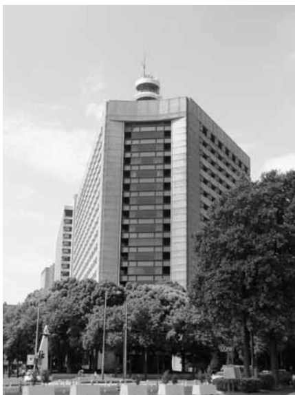
桜田門から望む警視庁

鱗屋敷は、三宅坂方面に向かう内堀通りと桜田通りに挟まれた、現在の警視庁辺りにあったという。