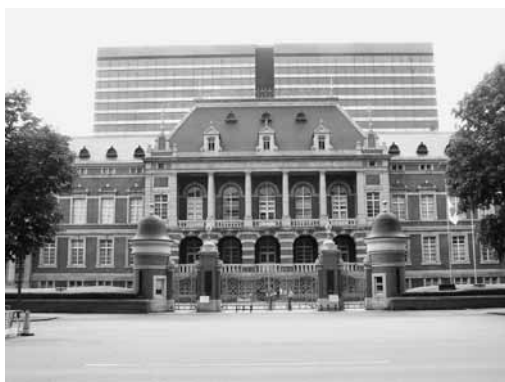
法務省旧本館正面

能装束に使われる模様の「鱗形」という言葉に代表されるように、鱗は三角形を意味する。警視庁の姿を思い浮かべれば、なるほどと思う。面積は2千坪余り。江戸時代の史資料に詳しい専門家に照会したが、当時はまだ「江戸切絵図」が作られておらず、地図として残されたものはないという。