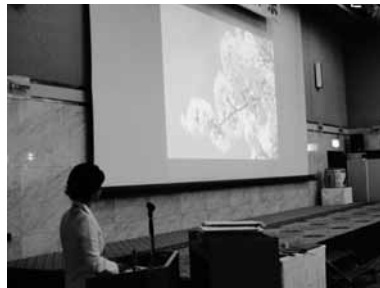
お堀の桜 思い出します