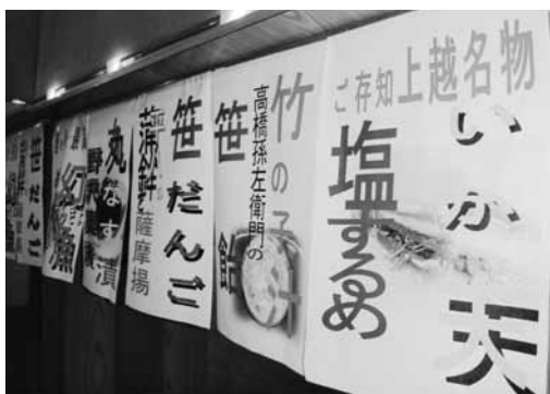
ふる里の味・味・味