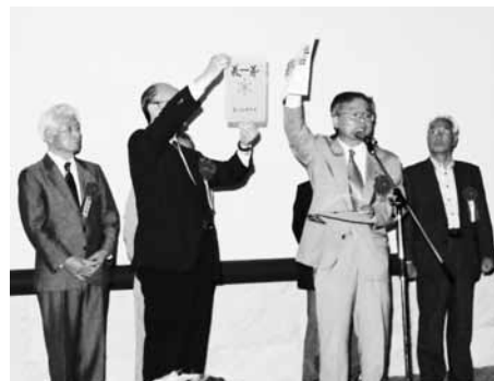
「第一義」のファイルを作りました。