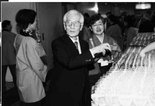
さあ～ いよいよ総会が始まります ウェルカムドリンクがお出迎え！