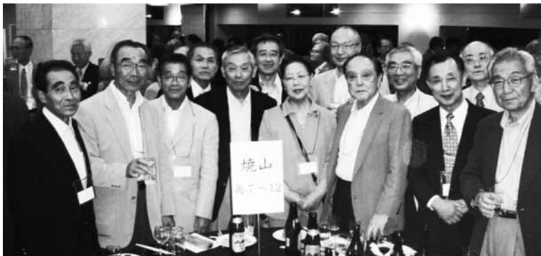
円熟味を増した私達 (高8回)