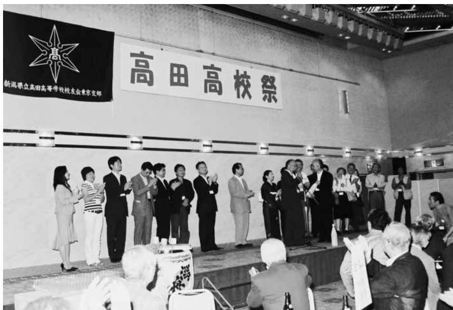
輝く高高校友会旗 初お目見え