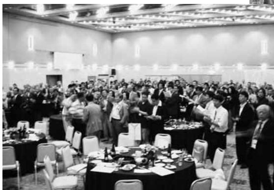
会場でも校歌斉唱