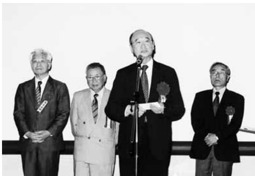
大島校友会副会長のご挨拶