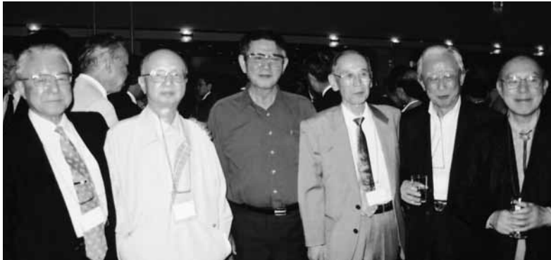
高3回のダンディな面々 「丸ナスとタケノコ汁が 食べたいからきたんだ よ」