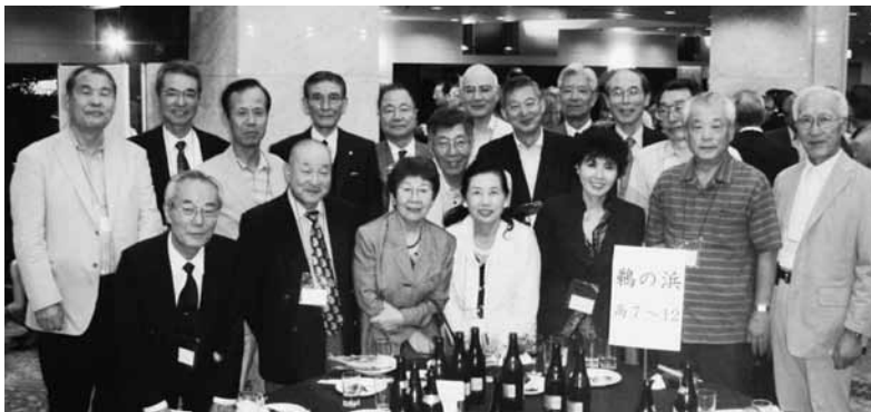
「団結力がありません 夢もあります」 (高11回)