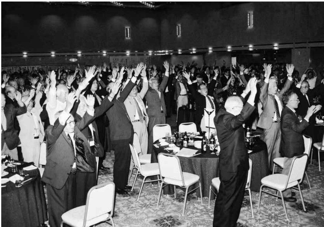
会場でも大きな声で「バンザイ！」