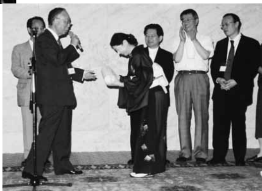
来年の当番年次引継ぎ、雪中梅の授与