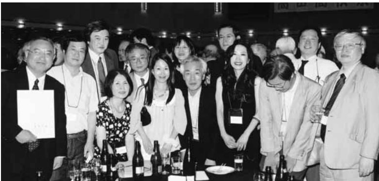
私達、草間学校長と同期 生です。 (高25回)