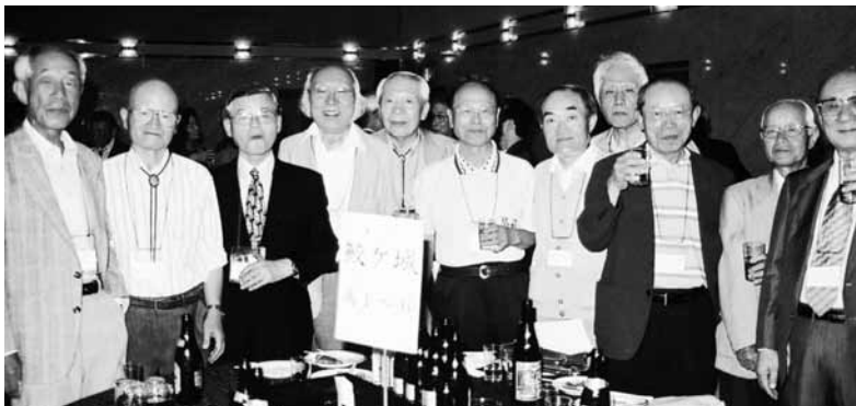
背すじシャツクリ、まだ まだ若い者には負けられ ません (高4回)