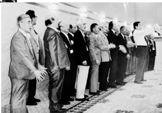
壇上で一生懸命校歌を歌う先輩達